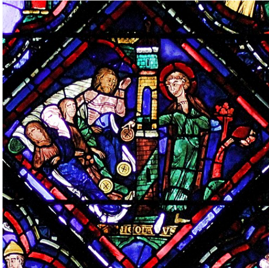
Het verhaal van de drie dochters (Venster kathedraal Chartres, 13de eeuw)